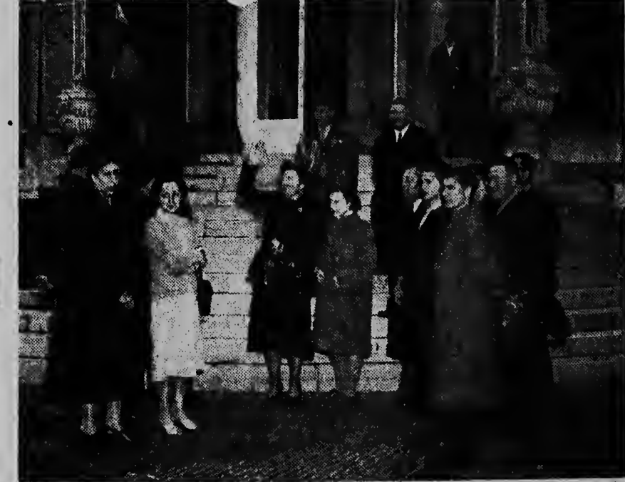
Den e dianan aki S.M. La Reina a ricibi na Paleis Soestdijk un deputacion di e refugladonan Hungaro cu a bini cu e ultimo transport Hulanda. Nan a haci un viahe cu bus cual tabata un carlinjo di bestuur dj gemeente Utrecht y nan a defila dilanti di S.M. Durante di e defile aki e bandera cu e Hungaronan a regala La Reina dia cha bishita e Jaarbeurshallen, riba e bordes di palacio. Riba e foto nos por mira S.M. La Reina kende tabata weicando e desfile huntu cu e deputacion y algun miembro di Cruz Roja.